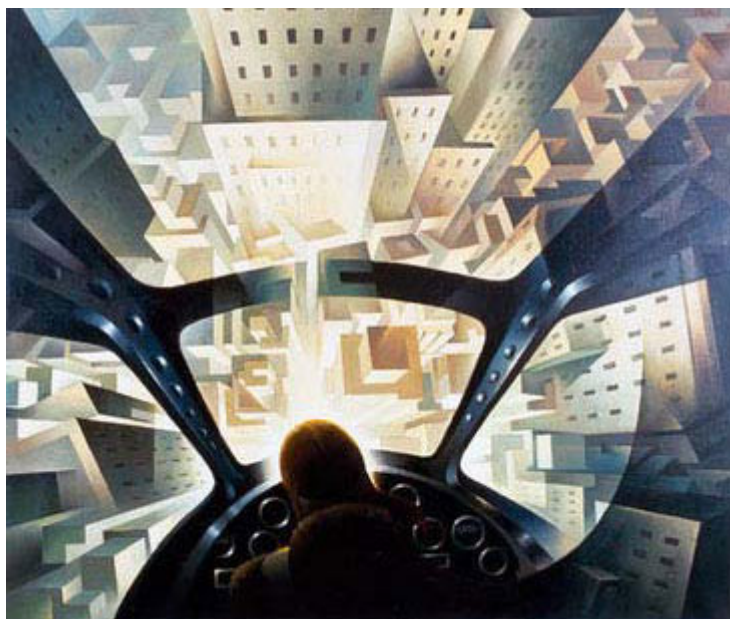
Футуристическая икона: Туллио Крали: «В пике над городом», 1939 год

Интересен также труд доктора Армина Молера «Фашистский стиль» [Armin Mohler: Der faschistische Stil , в: Liberalenbeschimpfung. Drei politische Traktate . Essen 1990], в котором он кратко касается встречи Готфрида Бенна и Маринетти. [Готфрид Бенн, выдающийся немецкий поэт, 1886-1956].