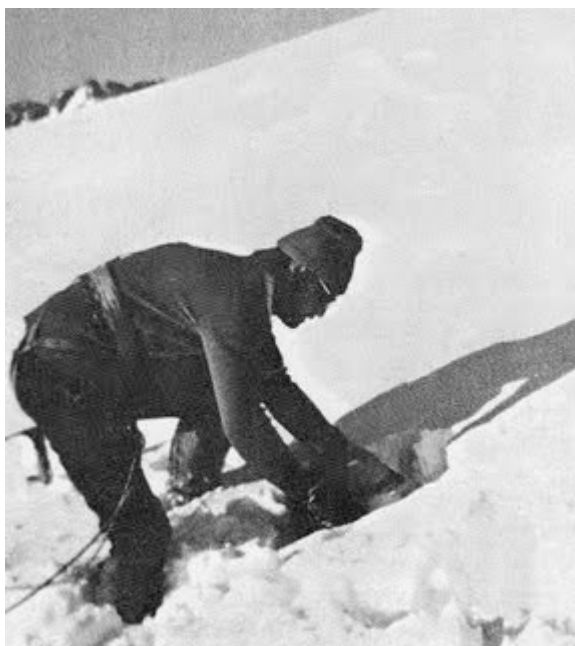
Финальная точка необычной жизни: Пепел Эволы погребают в вечном льде Монте-Розы (1974 год)

Каково значение, на твой взгляд, у циклической картины мира Эволы, которую он рассматривал как духовное наследие индогерманцев?