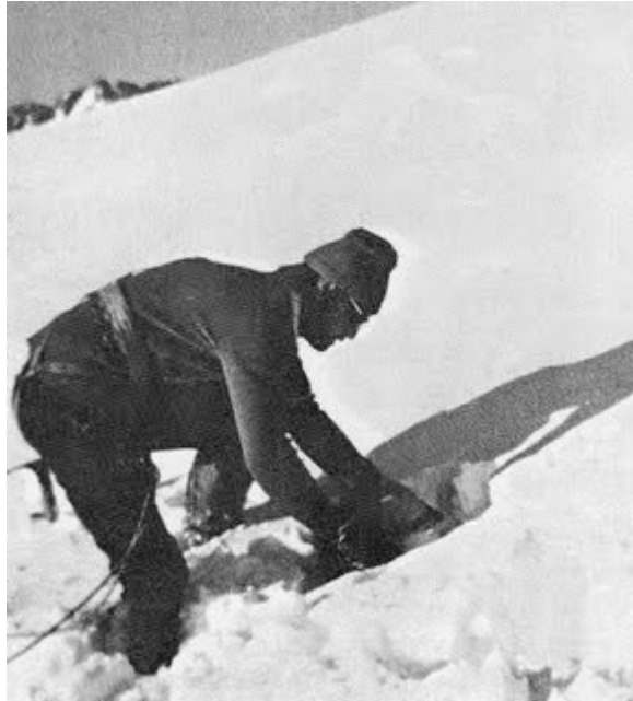
Финальная точка необычной жизни: Пепел Эволы погребают в вечном льде Монте-Розы (1974 год)

Каково значение, на твой взгляд, у циклической картины мира Эволы, которую он рассматривал как духовное наследие индогерманцев?