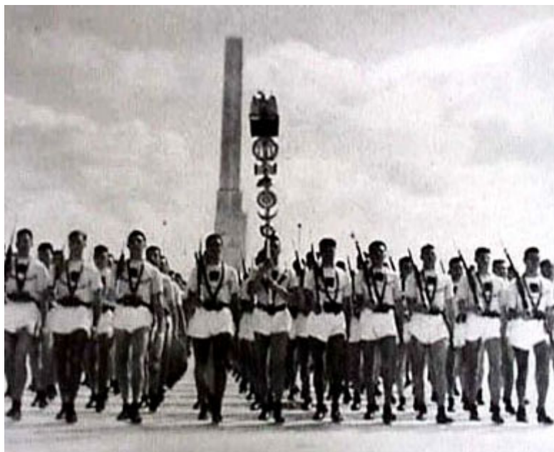
Фашистское восприятие: Фашистская молодежь (GIL) на демонстрации в Риме

Часто ошибочно интерпретируемая антитрадиция футуризма относится, как сказано выше, к пассивному консервированию прошлого. Вместо этого футуризм хотел быть активным. Он хотел жить тем, что мы понимаем под «традиционным». Футуризм также явно был направлен в окончательном виде снова только к точке нуля, и тоже, в конце концов, должен был после этого быть преодолен.