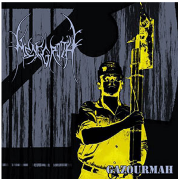
Блэк-металл под знаком традиционализма и гелиократии: Menegroth. Gazourmah

В этой связи мне вспоминается произведение Эволы «Магия как наука о Я» [Julius Evola/Gruppe von UR: Magie als Wissenschaft vom Ich. Grundlegung der Initiation (Band I) и Schritte der Initiation (Band II). Interlaken 1985], которое похоже на руководство для развития личности (в традиционалистском смысле?). Правда ли это? Насколько тяжело успешно идти этим путем?