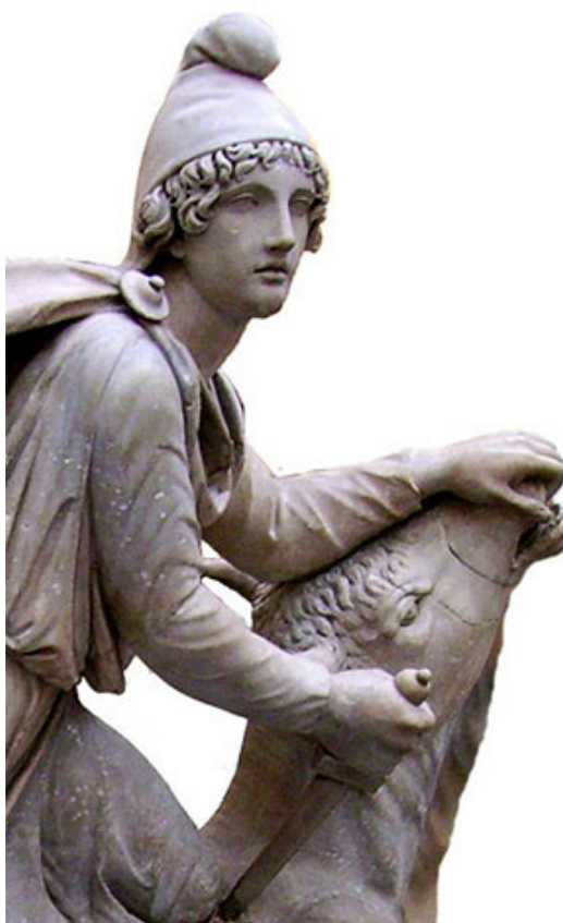
Митра убивает быка