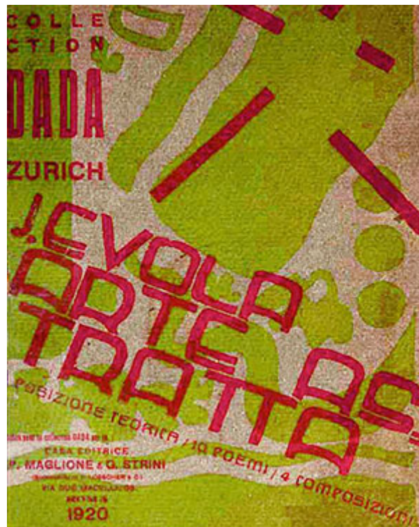
Произведение периода дадаизма Юлиуса Эвола: Arte Astratta (Цюрих, 1920 г.)