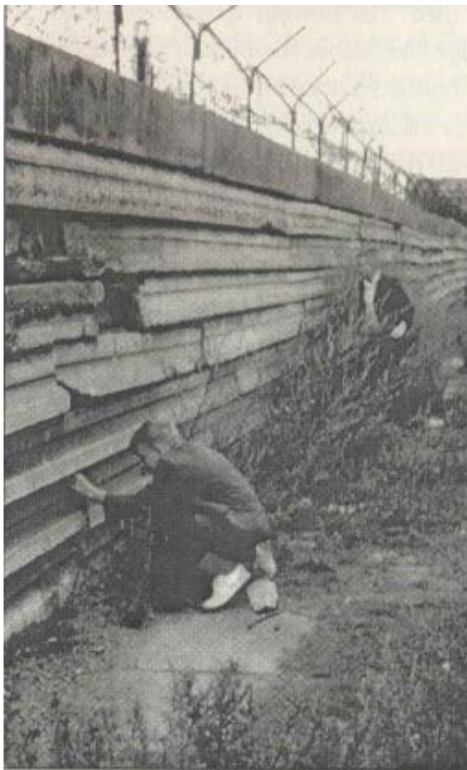
Стена около Контрольно-пропускного пункта Чарли. Мальчики охотятся за сувенирами. 1965 год.

Восточногерманским пограничникам было приказано стрелять в любого, кто попытался бы сбежать, и многие, кто пытался это сделать, погибли. Очевидный вопрос: почему те, кто запланировал сбежать, не бежали через границу, которая разделяла Восточную и Западную Германию? Эта граница тянулась от Балтийского моря на юг до Чехословакии, на расстояние 1398 километров (866 миль).