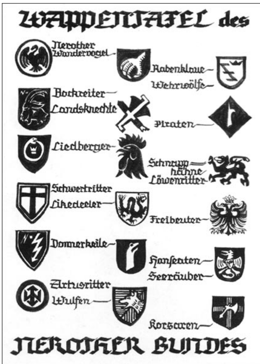
Гербы Неротер Бунда

Одновременно с Вандерфогель оформилась еще одна ветвь молодежного движения, сравнимая с ним по популярности, но во многом и отличная от него. Речь идет о движении скаутов, которое возникло в Англии в 1907 г. Как и в Германии, оно было отмечено стремлением молодых людей к первозданной природе. Источником вдохновения для них стала книга заслуженного генерала и выдающегося руководителя лорда Роберта Баден-Пауэлла (1857-1941) «Цели скаутства». Задуманная как полевой учебник британских солдат, она обрела неожиданную популярность среди английской молодежи. Отношение самого Баден-Пауэлла к этому факту было неоднозначным. С одной стороны, его радовала вновь возникающая связь молодежи с природой, невольным инициатором которой он стал; с другой – он не мог без тревоги наблюдать за тем, как книга, написанная с военными целями, формирует картину мира тысяч молодых людей. В результате для своих последователей им была написана еще одна книга «Скаутство для мальчиков», и он возглавил новое движение.