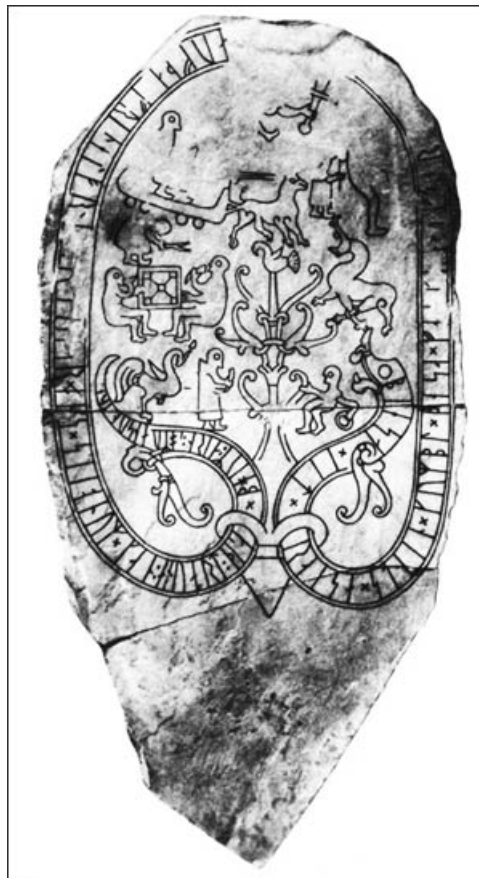
Runenstein der Ockelbo Kyrka (Kirche in Ockelbo, Schweden)

Wenn man sieht, wie beliebt das Brettspiel selbst heute noch ist, dann kann man sich vorstellen, welchen Stellenwert es zu früheren Zeiten einnahm, als es die vielfältigen Zerstreuungsmöglichkeiten unserer Tage noch nicht gab. Tatsächlich sind sie seit ältester Zeit ein fester und wichtiger Bestandteil des überlieferten Kulturguts. Sie dienten als geselliger Zeitvertreib und intellektuelle Herausforderung. In höheren Schichten gehörte die Kenntnis bestimmter Brettspiele nicht selten zur Etikette, und selbst religiöse Funktionen sind aus alter Zeit bezeugt. Das antike und frühmittelalterliche Europa machte hier keine Ausnahme, doch begann sich hier im zehnten Jahrhundert das aus Persien (ursprünglich vermutlich aus Indien) stammende Schach durchzusetzen und traditionelle Spiele zu verdrängen. Nur selten sind vollständige Regelwerke überliefert, und die Rekonstruktion dieser Spiele ist eine mühselige Arbeit.