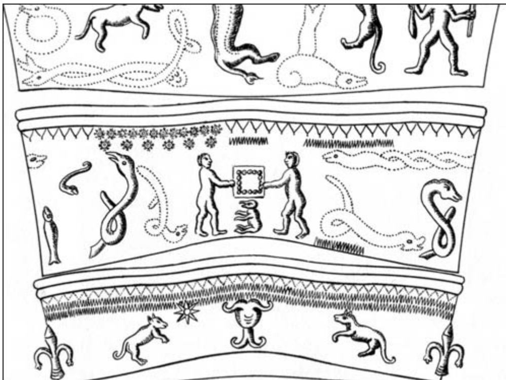
Goldhorn von Gallehus (Zeichnung)

Ist es überinterpretiert, hierin eine Reflexion nordischer Kriegerethik zu sehen? Man denke an die legendäre Todesverachtung unserer Vorfahren, in deren Vorstellung der Weg ins „Paradies“ nur denen offenstand, die im Kampfe gefallen sind, während alle anderen herablassend als „Strohtote“ bezeichnet wurden. Auch das Prinzip des Kampfes für einen Heerführer ist uns aus alter Zeit überliefert. Nur der Anführer kämpfte bei den Germanen für ein höheres Ziel, seine Gefolgschaft hingegen nur für ihn. Sein Überleben allein war wichtig, und es war eine große Schande, heimzukehren, wenn er gefallen war. Es erscheint nur logisch, daß die grundlegenden Wertvorstellungen eines Volkes auch Eingang in seine kulturellen Schöpfungen finden, und Hnefatafl, anders als das heute übliche Schach, wurde von Menschen unserer Art erschaffen.