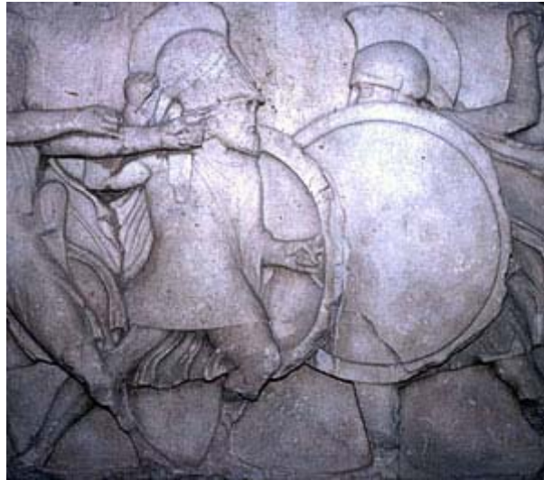
Nahkampf zweier Hopliten (Krieger zu Fuß)

Typisch sind der Korinthische Helm und der Rundschild, Hoplion . Der Bildhauer hat einen Krieger mit geöffnetem Helm dargestellt, um eine bekannte Person als Krieger zu würdigen.