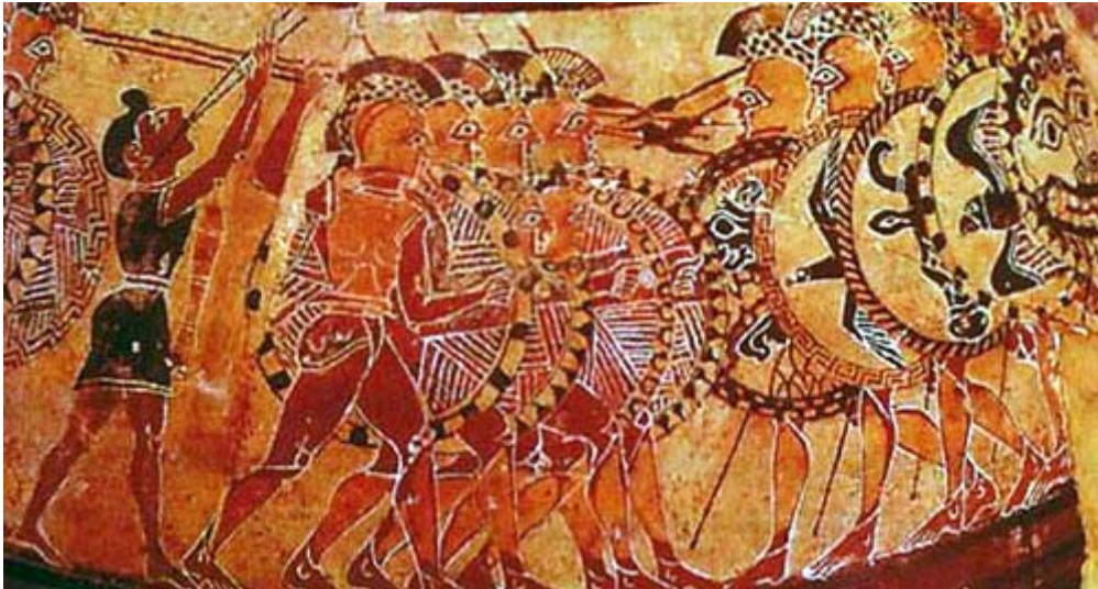
Hopliten werden von einem Flötenspieler in den Kampf geführt.