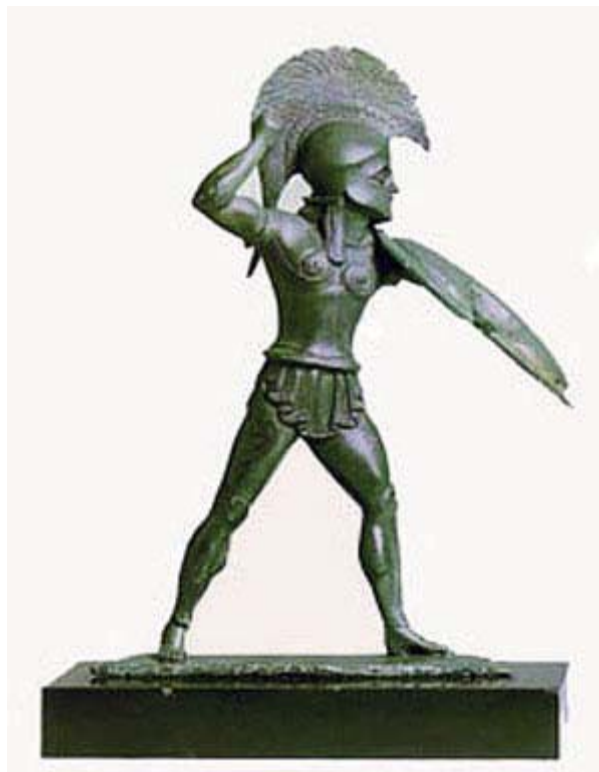
Statuette eines spartanischen Hopliten (13 cm hoch, um 510 v.d.Z.)

In dieser weltberühmten und oft zitierten Grabinschrift wird die Erinnerung an den Spartanerkönig Leonidas und dessen dreihundert Elitesoldaten, die 480 v. Chr. heldenhaft den Paß in der legendären Schlacht an den Thermopylen verteidigten, wach gehalten. Neben den unmittelbaren militärischen und politischen Folgen entfaltete dieses Ereignis seine weltgeschichtliche Bedeutung in dem hierdurch eingeleiteten Sieg gegen die anrennenden Perser und der damit ermöglichten Rettung des Abendlandes.