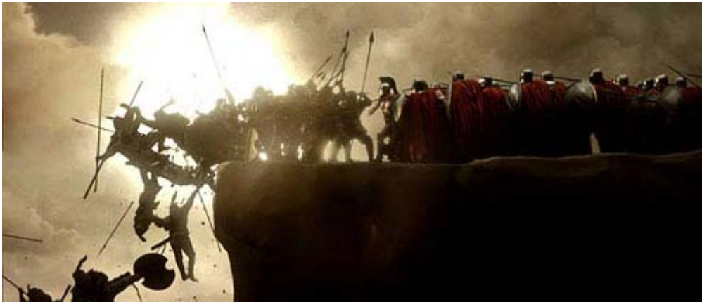
Filmische Umsetzung: Spartaner drängen den Feind zurück

Deutsche Rubrik | Velesova Sloboda | 2007