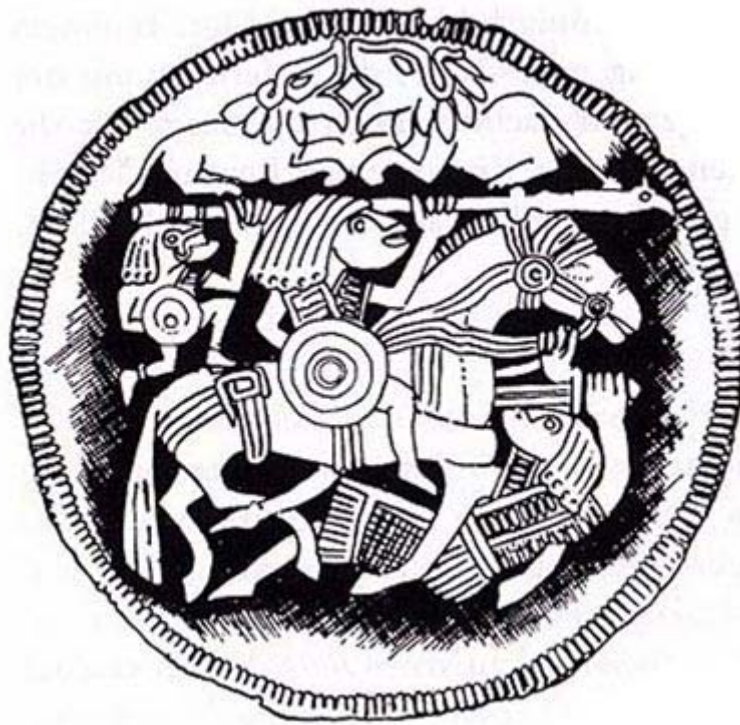
Der Sieghelfer von Pliezhausen

Den Aspekt die Macht des Gottes am Sieg über die Feinde prüfen und ablesen zu wollen, war für eine kriegerische Kultur essentiell. Dieses so genannte ‚Sieghelfermotiv‘ wird durch einen Fund des späten 7. oder 8. Jhd. deutlich. In Pliezhausen bei Tübingen 4 wurde unten abgebildete Zierscheibe gefunden, die den Kampf zwischen einem Reiter und einem Schwertkämpfer zeigt, der im Kampf zu Boden geht. Obwohl der Reiter im vollen Galopp im Begriff ist, seinen Speer gegen den oder die Feinde zu schleudern, gelingt es dem am Boden liegenden Krieger, die Zügel des Pferdes zu ergreifen. In diesem Moment greift der göttliche ‚Sieghelfer‘ ein, der als beschilderte kleinere Figur am linken oberen Rand der Scheibe zu sehen ist und mit seiner überdimensioniert großen Pranke den Speer des Reiters umfaßt und diesen beim Wurf stärkt. Hier muß von heidnischen Vorstellungen des Trägers der Zierscheibe ausgegangen werden. Immerhin zu einer Zeit, in der die Christianisierung der kontinentalgermanischen Stämme im Abschluß begriffen war. Ein beeindruckender Beleg für die zähe Langlebigkeit germanischer Kulturmuster.