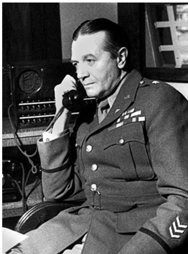
Генерал Чарльз А. Уиллоуби (1892-1972)

Генерал Чарльз А. Уиллоуби, начальник разведки Макартура в оккупированной Японии, инициировал годичное расследование подрывных элементов в своей собственной штаб-квартире и в Вашингтоне. Уиллоуби писал: «Похоже, существует расовая и географическая близость к коммунизму, и неконтролируемая иммиграция превратилась в канал подрывной деятельности». Уиллоуби после выхода в отставку стал более четко обозначать их как еврейское влияние. Например, он жаловался, что беспринципный Эйзенхауэр снял Паттона с должности «по приказу Франкфуртера, Бней-Брит и еврейских заговорщиков». [23]