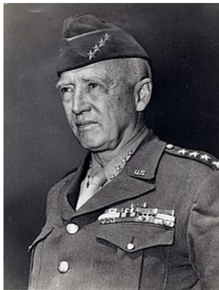
Генерал Джордж Смит Паттон (1885-1945)