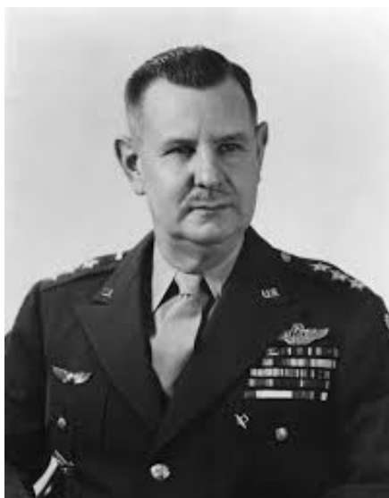
Генерал Джордж Э. Стрейтмайер (1890-1969)

Многие другие американские военачальники также пришли к выводу, что евреи повлияли на Америку, чтобы та вступила во Вторую мировую войну. Так, генерал Альберт К. Ведемейер написал отставному полковнику Трумэну Смитю через несколько лет после войны, что британцы, сионисты и коммунисты сделали вступление американцев в войну неизбежным. По словам Ведемейера, они были мотивированы эгоистическими интересами, а не благополучием человечества. Он заявил, что «большинство людей, связанных с коммунизмом в его первые дни, были евреями». Ведемейер также утверждал, что еврейские советники Рузвельта «делали все возможное для распространения яда и ненависти к нацистам и для возбуждения Рузвельта против немцев». [18]