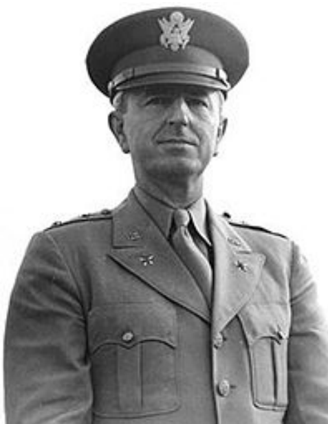
Генерал Альберт К. Ведемейер (1897-1989)