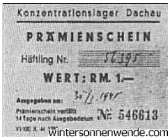
Купюра лагерных денег из Дахау