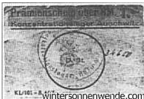
Купюра лагерных денег из Освенцима