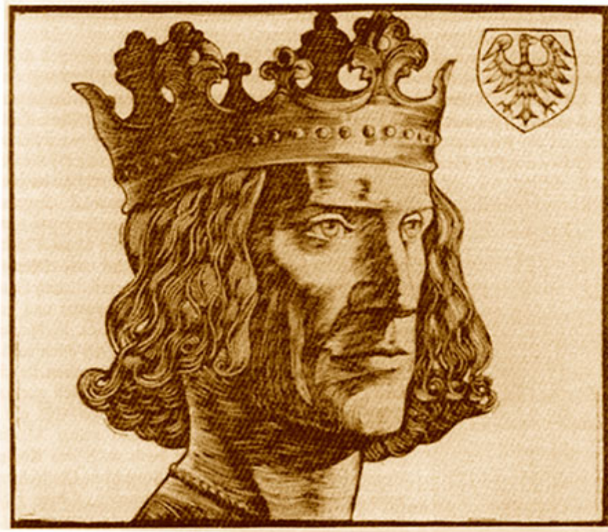
Heinrich I. (Holzschnitt von Ernst von Dombrowski 1938/1940)

Dombrowski hat sich bei der Gestaltung an dem Bamberger Reiter (vor 1237) im Dom zu Bamberg und an dem Magdeburger Reiter (stellt König Otto I. dar, Mitte des 13. Jahrhunderts) auf dem Alten Markt in Magdeburg orientiert. Beide sind herausragende Kunstwerke der staufischen Klassik. Der Holzschnitt wurde mit verschiedenen Wahlsprüchen in zahlreichen Publikationen veröffentlicht und auch in die seit 1937 in München stattfindende Große deutsche Kunstausstellung (Haus der deutschen Kunst, München) aufgenommen.