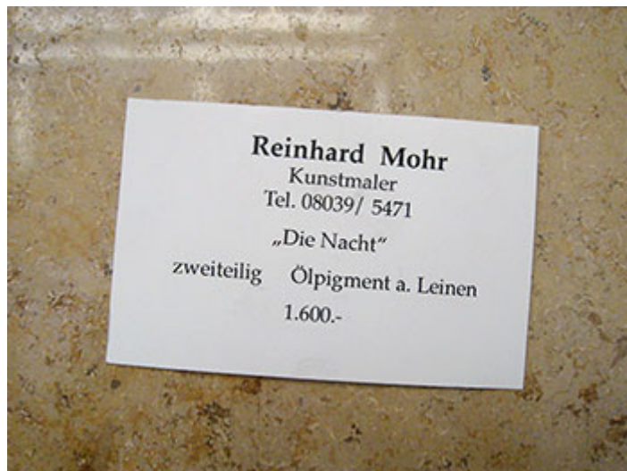
Zum hohen Preis