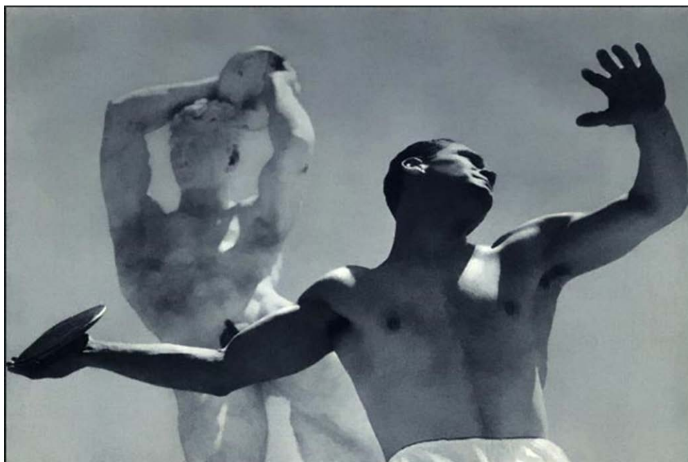
Дискобол. Человек и мраморная статуя.

(Опубликовано в: Новое обозрение , в 1942 году)