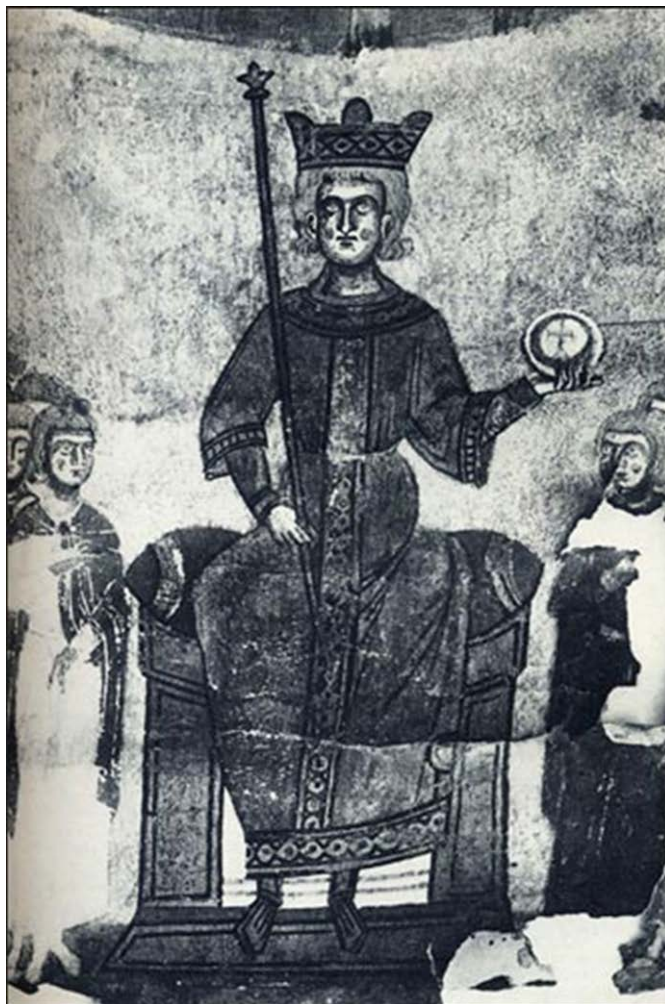
Император Фридрих II. Миниатюра того времени на пергаменте (1230), сокровище собора в Салерно.

Так как Благородный дух предшествует всем своим проявлениям и поднимается над ними, вопрос любой конкретной аристократической структуры предполагает углубленное знание сущности этого духа. Нужно отдавать себе отчет, во всяком случае, что при восстановлении речь не идет только о чисто политическом, более или менее связанном с административными и законодательными структурами государства классе. Речь здесь идет, прежде всего, о привязанном к определенным слоям престиже и примере, которые должны создавать атмосферу, выкристаллизовывать более высокий стиль жизни, пробуждать особенные формы ощущения и тем самым задавать тон для новой общности. Поэтому можно было думать о чем-то вроде ордена, в мужском и аскетическом смысле, присущему этому выражению в габеллинской средневековой культуре. [Габеллины – это ключевое понятие европейского средневековья. Понятие габеллинов появляется к началу тринадцатого века в имперской Италии. Оно происходит от родового замка салической династии Вайблинген, и было в итальянском языке пе-