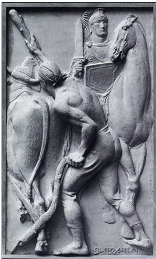
Филиппо Сгарлата: Плуг под защитой меча (XXI Биеннале современного искусства, Венеция, 1938 год).

© Публикация и редактирование текста, послесловие, краткая биография, Зиглинг (июль 2006 года). Специально для Немецкой рубрики Велесовой Слободы. Перевод с немецкого: 2012 год.