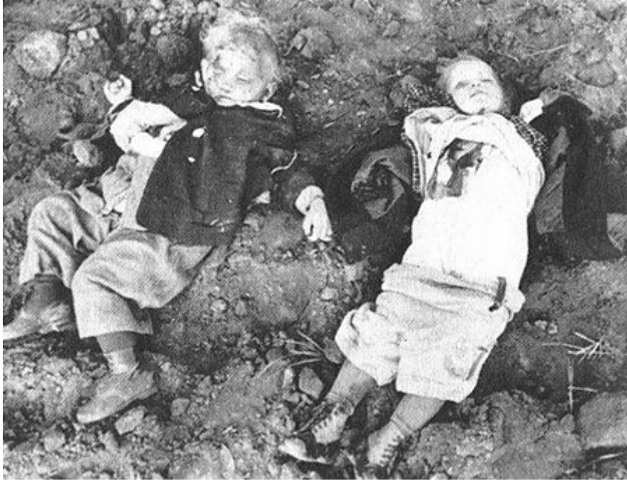
На фото: Восточная Пруссия. Убитые немецкие дети.

Именно гражданские Восточной Пруссии, прежде всего женщины, дети и старики, в ужасе бежавшие от пьяных сталинских орд, составили абсолютное большинство пассажиров печально знаменитого лайнера «Вильгельм Густлофф», который был потоплен 30 января 1945 года советской подлодкой под командованием пресловутого Маринеско. Из более чем 10 тысяч человек, находившихся на борту лайнера, по разным оценкам погибло от 7 до 9 тысяч (напомню, стоял 18-градусный мороз, в море плавали льдины). Гибель «Вильгельма Густлофф» стала крупнейшей морской катастрофой в истории (подробнее об этом – в известном романе Гюнтера Грасса «Траектория краба» ).