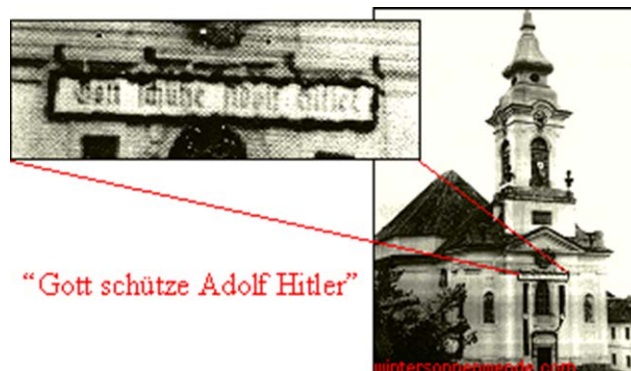
Транспарант на церкви в Судетах в 1938 году: «Боже, храни Адольфа Гитлера!»

Неужели можно на самом деле поверить, что Германская империя смогла бы заключить договор по флоту с Англией, договоры с Италией, Румынией и Японией и даже с Советской Россией, если бы хотя бы некоторые из распространенных вымыслов соответствовали бы действительности? Никогда!