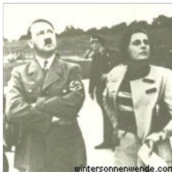
Гитлер с кинорежиссером Лени Рифеншталь

В одном можно быть уверенным: политики понимают «в театре» больше, чем актеры в политике. И это было так, пожалуй, во все времена и у всех народов.