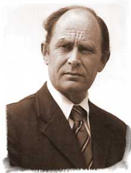
Энтони Саттон (1925 – 2002)