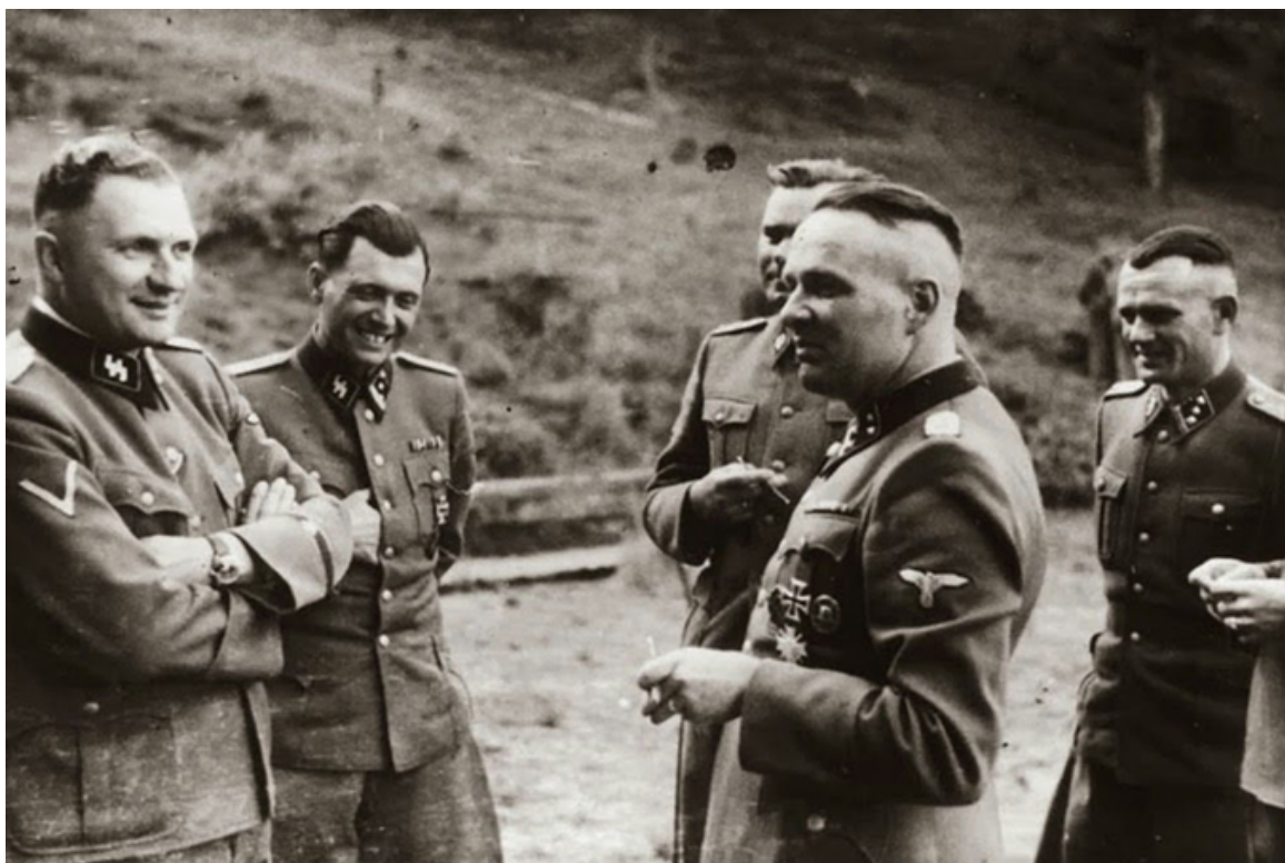
Офицеры СС в Освенциме. Слева направо: Рихард Бэр, Йозеф Менгеле, Йозеф Крамер, Рудольф Хёсс