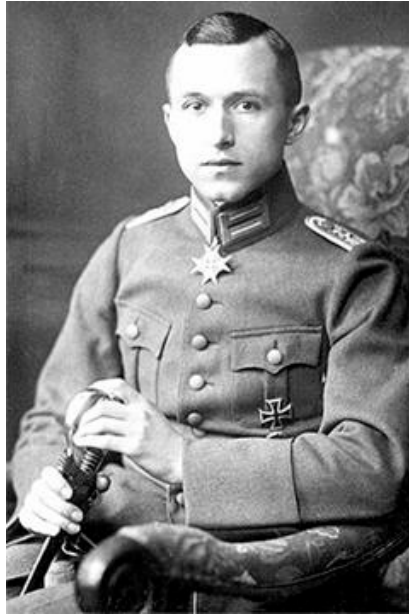
«Прусский анархист»: Эрнст Юнгер

понятия «тотальной мобилизации», был перейден временной порог, за которым больше нет никакого возврата.