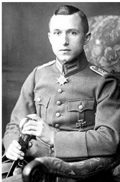
«Прусский анархист»: Эрнст Юнгер

Без сомнения, как Эвола, так и Юнгер были циклическими мыслителями – как в творчестве Эрнста Юнгера, так и в творчестве его брата Фридриха Георга мотив возвращения играет важную роль. Где Эвола констатирует духовный упадок человека, который все сильнее теряет контакт с любой метафизической действительностью, там Юнгер в своем большом эссе «An der Zeitmauer» («У стены времени») занимается астрологическими предположениями о так называемых мировых годах в цикле прецессии, которые, согласно Юнгеру, обнаруживают разные свои качества. Теперь это звучит как что-то в духе эзотерики «New Age», но Юнгер продолжает здесь свои соображения из «Рабочего», по которым в ходе процесса индустриализации и механизации планеты, описанным Юнгером с использованием понятия «тотальной мобилизации», был перейден временной порог, за которым больше нет никакого возврата.