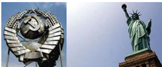
Красный и золотый Интернационал – фикция?

Здесь, наверное, есть некоторое сходство в утопических целевых представлениях, но это не значит, что коммунизм и либерализм были хоть как-то похожи друг на друга также в их экономике и системе собственности, или что они могли бы образовать «союз капитала».