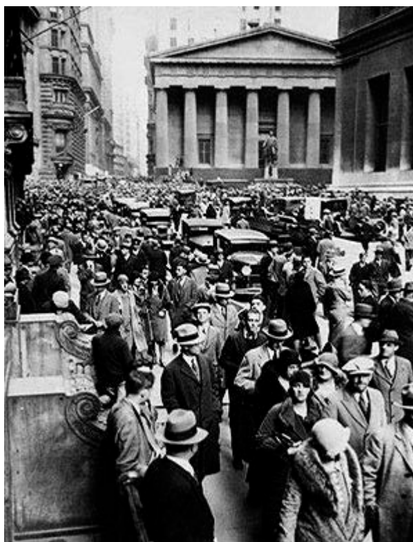
1929 год: Паника на Уолл-стрит – последствия мирового экономического кризиса затянули Европу в пропасть

«Такие же оптимистичные прогнозы, однако, раздавались столь же регулярно на протяжении всего мирового экономического кризиса с 1929 по 1933 годы, о чем сегодня очень мало известно».