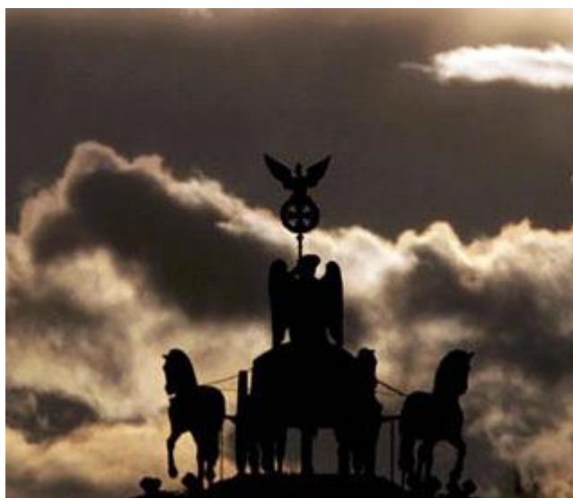
Квадрига Бранденбургских ворот: Символ погибшей эпохи

«Однако такие исторические рассмотрения не должны отвлекать внимание от того, что за прошедшее время полностью пали также и буржуазные общества девятнадцатого века, и что на их место пришло глобальное и культурно и социально нивелируемое массовое общество, основанное на массовом потреблении».