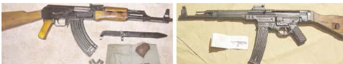
Хуго Шмайссер не имел отношения к созданию АК-47 (слева). Несмотря на некоторое сходство автоматов

Правда, редкие в СССР пытливые умы удивлялись, отчего это у немецких солдат в конце войны мелькает вроде бы копия автомата «калашникова»? Ой, да то чисто случайное совпадение: штурмовая винтовка вермахта Sturm-gewehr-44, созданная Хуго Шмайссером.