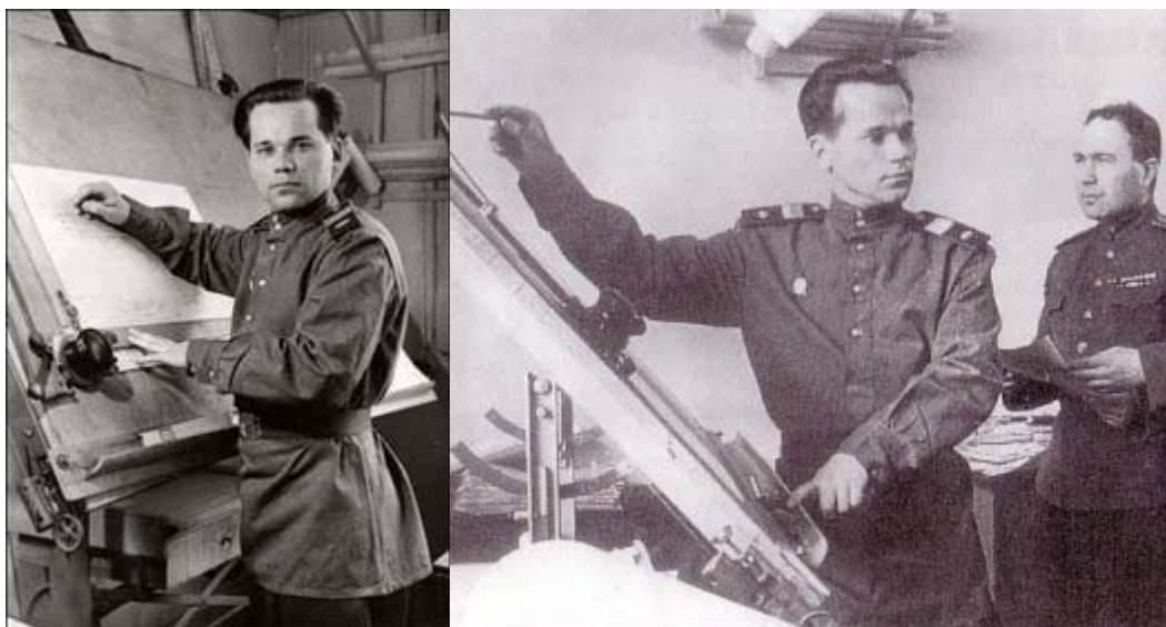
Конструктор Михаил Калашников (1949)

Калашников вообще понравился советским товарищам как замечательная пропагандистская идея. Посмотрите соответствующие гламурные фотографии.