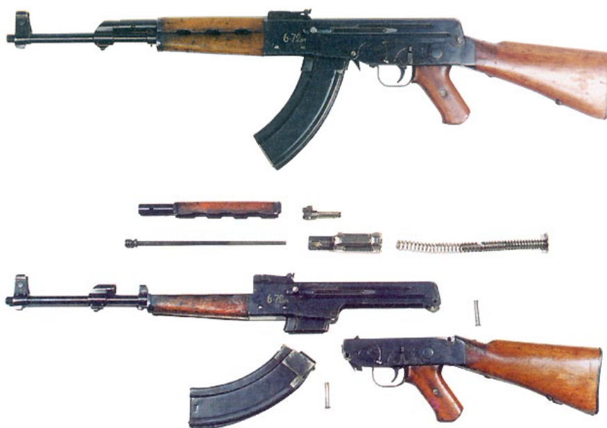
первый опытный автомат Калашникова под патрон 7.62x41, 1946 год, также известный как АК-46