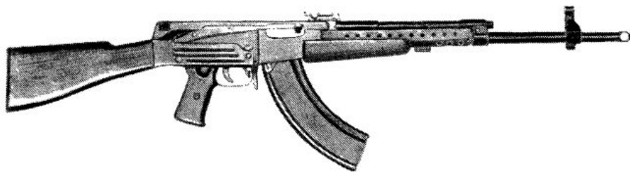
Первый советский автомат под промежуточный патрон образца 1943 года (7.62x41) – автомат Судаева АС-44, проходивший войсковые испытания весной-летом 1945 года.

В 1946 году начался конкурс на автомат под промежуточный патрон, участвовало полтора десятка конструкторов.