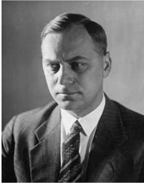
Альфред Розенберг (1893-1946)

Кем был этот довольно тихий и замкнутый, даже застенчивый человек с мягкой внешностью английского чиновника из высшего класса? Судя по всем свидетельствам, он был в своей личной жизни добродушным человеком, без чувства юмора, неподкупным. В его фанатичной преданности национал-социалистической идеологии не было ни цинизма, ни прагматизма, но его фанатизм становился красноречивым только в его письменных работах. Ему не хватало экстравагантной общительности, чтобы быть хорошим собеседником. Эта интроверсия, конечно же, не была характерна для подавляющего большинства нацистских лидеров. Она не была характерна даже для Гесса, эмоциональная отчужденность которого, похоже, возникла в результате обращения с ним его британских порабитителей после его полета в Шотландию в 1941 году с мирной инициативой. Кажется, что Розенберг бывал порой мишенью грубого юмора в этих кругах, и не в последнюю очередь из-за его фамилии, которая, как правило, считалась еврейской, хотя в балтийском регионе, откуда он был родом, это была также обычная нееврейская фамилия. Тем не менее, Розенберг всегда оставался полностью лояльным и, кроме самого Гитлера, он был единственным членом партии, который оставался видным деятелем партии с самых ранних дней до самого конца. Но по своим навыкам или характеру Розенберг не подходил для грубой практики повседневных дел.