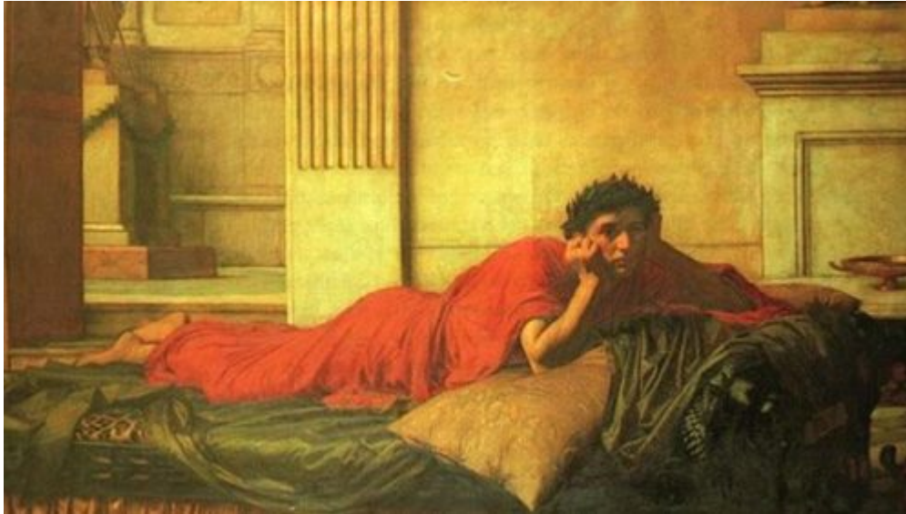
Нерон: вырожденный извращенец, даже по современным меркам

Я не могу претендовать на то, что прослежу всю историю гомосексуализма в западном мире. Перед неизбежным падением Римской империи христианство, прямо определяющее гомосексуализм как преступление против Бога, укрепилось и стало официальной религией, и когда разрушенное червями здание империи рухнуло, ее территория в Западной Европе была занята свежими и энергичными народами. И поскольку многие из них были германцами, то они принесли с собой инстинктивное отвращение к извращению, и это отвращение еще больше укрепило учения Церкви. Поэтому в качестве обобщения можно сказать, что в западном мире, начиная с падения Римской империи и до времен Французской революции, гомосексуализм был запрещен и наказывался по очень строгим законам, как церковным, так и гражданским. И эти законы применялись на практике, даже против лиц высокого ранга. В Англии, например, лорд Одли, граф Каслхейвен, был осужден за содомию и казнен в 1631 году. И даже еще в 1810 году, по крайней мере, один офицер в британской армии и один рядовой солдат были казнены за то же преступление. Возможно, это был последний раз, когда была применена смертная казнь. В том же году люди, пойманные полицией в ходе рейда на гомосексуальный бордель в Лондоне, были просто приговорены к позорному столбу. Но это было не совсем легкое наказание, поскольку возмущенное население позаботилось о том, чтобы они вернулись в тюрьму больше похожие на кучи мусора, чем на людей.