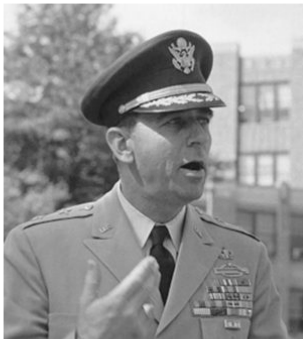
Генерал-майор Эдвин А. Уокер