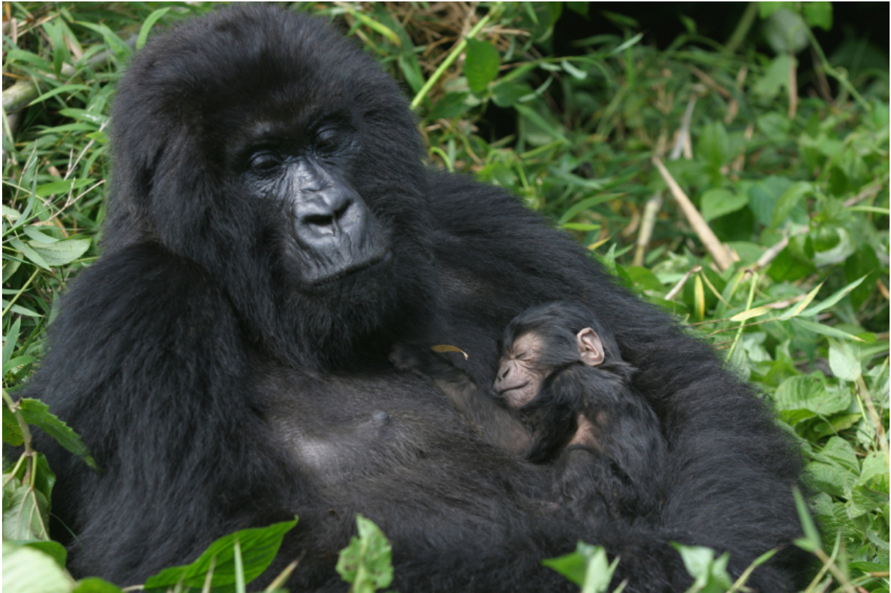
Горная горилла с детенышем

седних зарослях раздался шорох, и на меня уставилось прекрасное доверчивое лицо Мачо. Она отстала от группы, чтобы подойти ко мне. Увидев необыкновенную доброту, спокойствие и доверие в глазах Мачо, я была до глубины души потрясена нашей близостью и никогда не забуду этого трогательного момента». Мачо принадлежала к гарему гориллы, которую мисс Фосси назвала Дядюшкой Бертом, и она была особенно огорчена, когда обе обезьяны были убиты, когда они, очевидно, пытались защитить их грудного ребенка либо от браконьеров, либо от чиновников негритянского правительства, которое хотело произвести впечатление на посещающих журналистов.