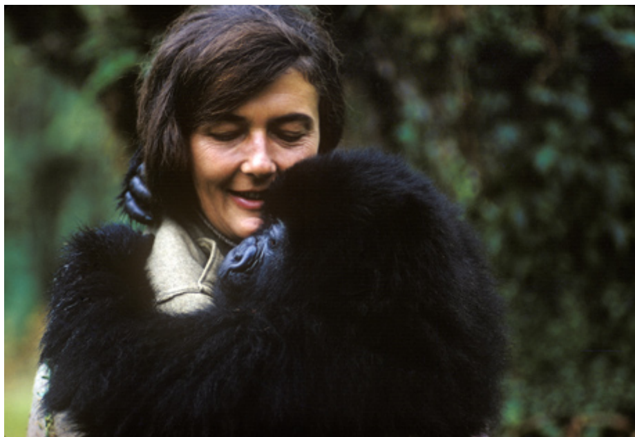
Дайан Фосси с детенышем гориллы

(Сноска 1: Книга хорошо напечатана и снабжена прекрасными фотографиями. Мисс Фосси пишет вообще приемлемую прозу, но хотя издатели ее книги – одни из наиболее уважаемых из тех, кто все еще остается в этом бизнесе, их редакторы, вероятно, кое-где поддались сонливости. Например, на странице xviii можно прочитать: «Планирование доктора Лики было действительно случайным (fortuitous) [так!]. За эти шесть с половиной лет [с момента последнего исследования горилл] ... соотношение взрослых самцов и самок горилл ... уменьшилось ..., сопровождаемое уменьшением популяции наполовину». Мисс Фосси не намеревалась писать такую чепуху, таким образом, она, должно быть, написала или намеревалась написать не «fortuitous», а «fortunate» – 'удачное'. Но даже этого не будет достаточно, хотя читатели, уже привыкшие к катахрезам и солецизмам в прозе наших современников, могли бы догадаться о значении, которое не было выражено. Автор имел в виду: 'Удачей было то, что доктор Лики решил сделать новое исследование так быстро после предыдущего', то есть, прежде, чем популяция горилл уменьшилась более чем наполовину.)