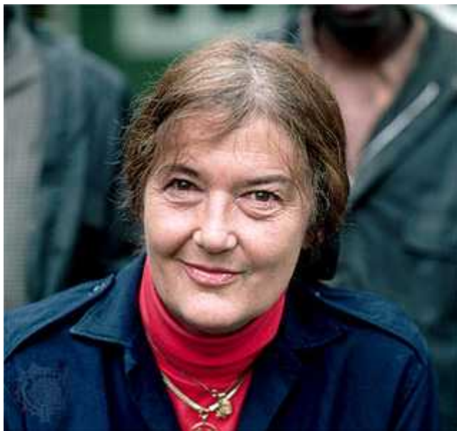
Дайан Фосси (1932-1985)

На маленькой опушке на покрытом туманом склоне горы Бисоке (горный массив Вирунга) на высоте девять тысяч футов над уровнем моря, и посреди маленького заповедника, который она пыталась сохранить для вымирающей расы горных горилл, которым она посвятила свою жизнь, мисс Фосси жила одна в хижине на некотором расстоянии от хижины, занятой ее помощником-мужчиной, и от лагеря ее работников-туземцев. Она, очевидно, спала, когда ее лицо и голова были расколоты одним ударом мачете.