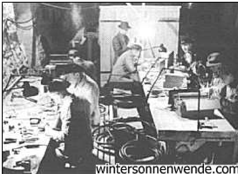
Техники на подземной фабрике работают над улучшением ракет.

(А-4 и «Фау-2» – это разные названия одной и той же ракеты. – прим. перев.)