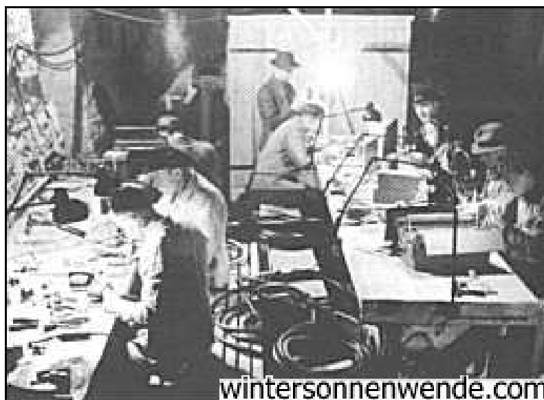
Техники на подземной фабрике работают над улучшением ракет.

(А-4 и «Фау-2» - это разные названия одной и той же ракеты. – прим. перев.)