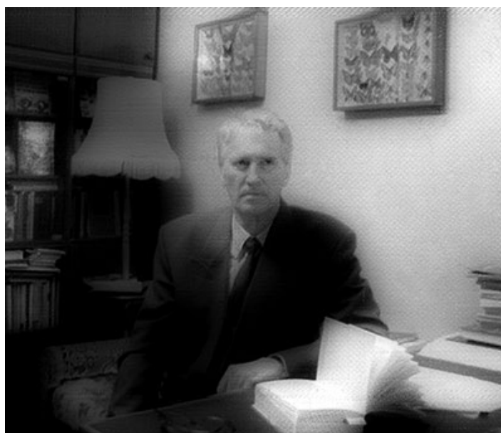
Профессор, доктор биологических наук Екатеринбург