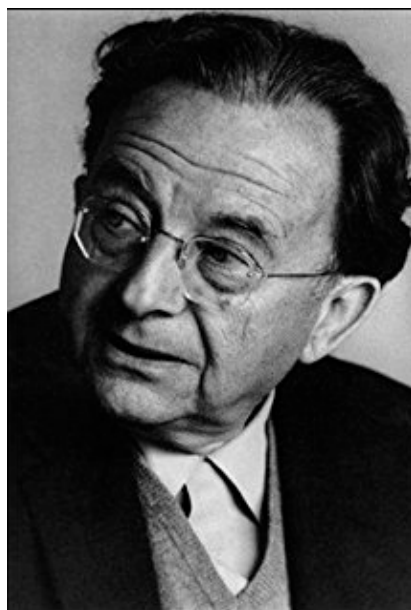
Эрих Фромм (1900-1980)

Он предполагал, что тот же самый капиталистический общественный порядок привел к теории предопределения Кальвина, которая со своей стороны отражала принцип фундаментального неравенства, снова возродившийся в национал-социалистической идеологии.