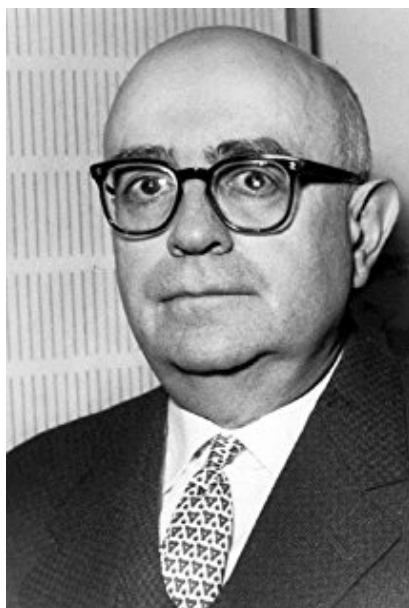
Теодор Адорно (1903-1969)

Вместе с другими Адорно был автором опубликованной в 1950 году книги «Исследование авторитарной личности».