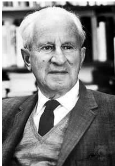
Герберт Маркузе (1898-1979)

На студенческих революционеров также очень сильно повлияли идеи Герберта Маркузе, еще одного члена Франкфуртской школы. Маркузе проповедовал «Великий отказ» (неприятие всех основных западных концепций), сексуальную свободу и ценность сопротивления феминисток и негров. Его первоначальный тезис был, что университетские студенты, негры из гетто, отчужденные, асоциальные элементы и третий мир могли бы занять место пролетариата в коммунистической революции. В своей книге «Эссе об освобождении» Маркузе представил свои цели радикального переворота ценностей: отмена табу, культурный переворот, Критическую теорию, и революцию в области лингвистики, которая должна была привести к методическому изменению значений используемых слов. О расовом конфликте Маркузе писал, что белые мужчины виновны, и черные представляют собой самую естественную силу мятежа.