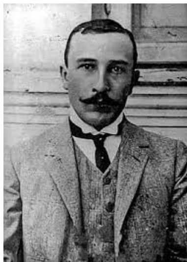
Борис Викторович Савинков (1879-1925)

Снова и снова бойцы задаются вопросом, действительно ли они сражаются на стороне народа и истинной России. Как и в «Бледном коне», сдержанная, хладнокровная литературная стилизация превращается в маску и доспехи повествователя от первого лица, под защитой которых он, проницательный наблюдатель и одновременно увлекаемый потоком событий активный участник происходящего, движется сквозь хаос «безрассудства, буйства и бунта».