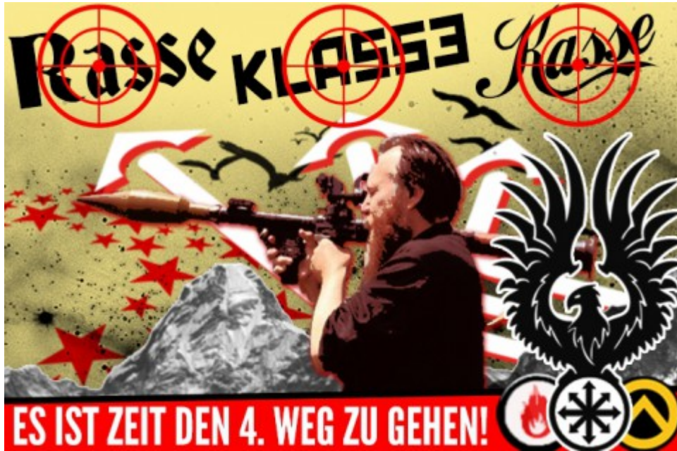
На картинке «раса», «класс» и «касса» находятся под прицелом. Лозунг внизу гласит: «Настало время выбрать четвертый путь!».