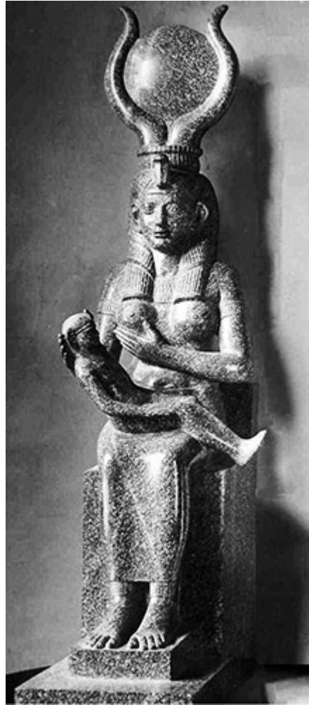
Исида кормит грудью своего божественного сына Гора (египетская скульптура времен правления династии Птолемеев, 304-30 до н.э.)

В греческих мифах мы, напротив, находим «несколько сентиментальное описание странствующей матери, которая не находит место, где может родить своего ребенка» в форме матери Аполлона, которая также не находила убежище, и которую поэты изображают в подобном виде. Так же у скульптора Каллимаха изображен замотанный в пеленки ребенок Зевса, а дитя Диониса изображается в веялке, подобно тому, как у евангелиста Луки – ребенок в яслях.