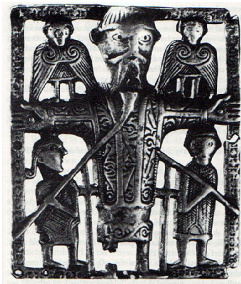
Ирландско-германская сцена распятия, в которой Христос представлен в традиции Одина / Водана, в сопровождении двух ангелов (воронов?) на его пле-

В этот ряд также вписывается самобичевание Одина, висящего на древе ради приобретения мудрости. Параллельно к этому вызывающий дискуссии рельеф на скалах Экстернштайна интерпретируется как изображение распятого.