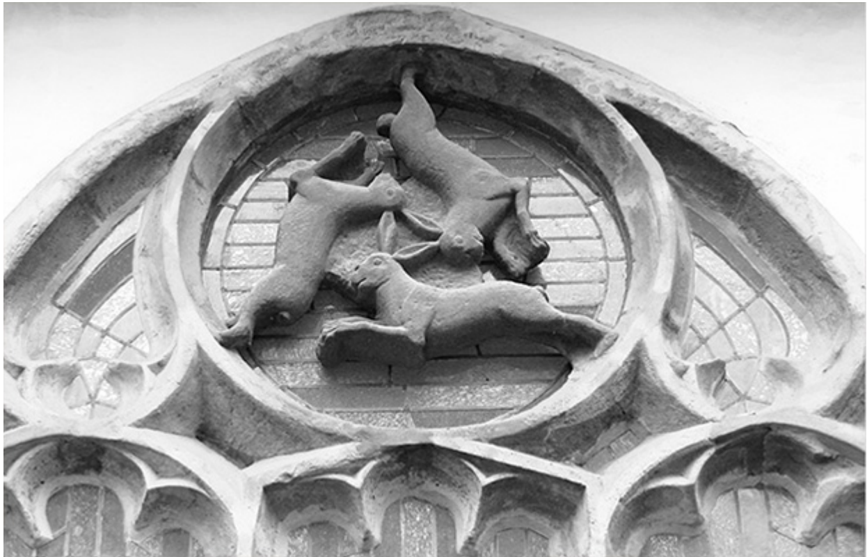
Окно с тремя зайцами. Падерборнский собор

Празднуемое в августе «Вознесение Марии» заменило более древний языческий праздник благодарности за урожай, тесно связанный с Матерью-землей, как символом плодородной почвы, порождающей плоды, из чего нужно, кстати, даже выводить сам слог «Ма» в имени «Мария». Как супруга небесного божества представление о вознесении также опирается на язычество.