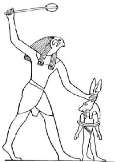
Гор, убивающий Сета

– Прокла и Дамаския Диадеха), явным образом перекликается со всем, что до этого говорилось про волны космических энтелехий, воздействующие на человека. Наряду с Высшим Логосом (Ишварой-Иисусом, Осирисом, М-волнами) в человеке проявлены также активности Хора (высшего манаса, или R-волн), а также Сета (низшего манаса, S-волн, холодной окостеневшей рациональности).