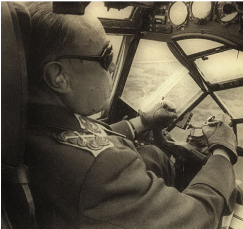
Kesselring in seinem FW 189 über den Weiten Rußlands