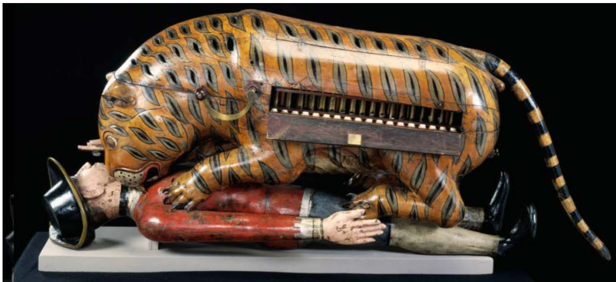
Тигр Типу в Музее Виктории и Альберта, Лондон

эта фигурка теперь принадлежит Музею Виктории и Альберта, в котором хранятся любопытные предметы из колоний.