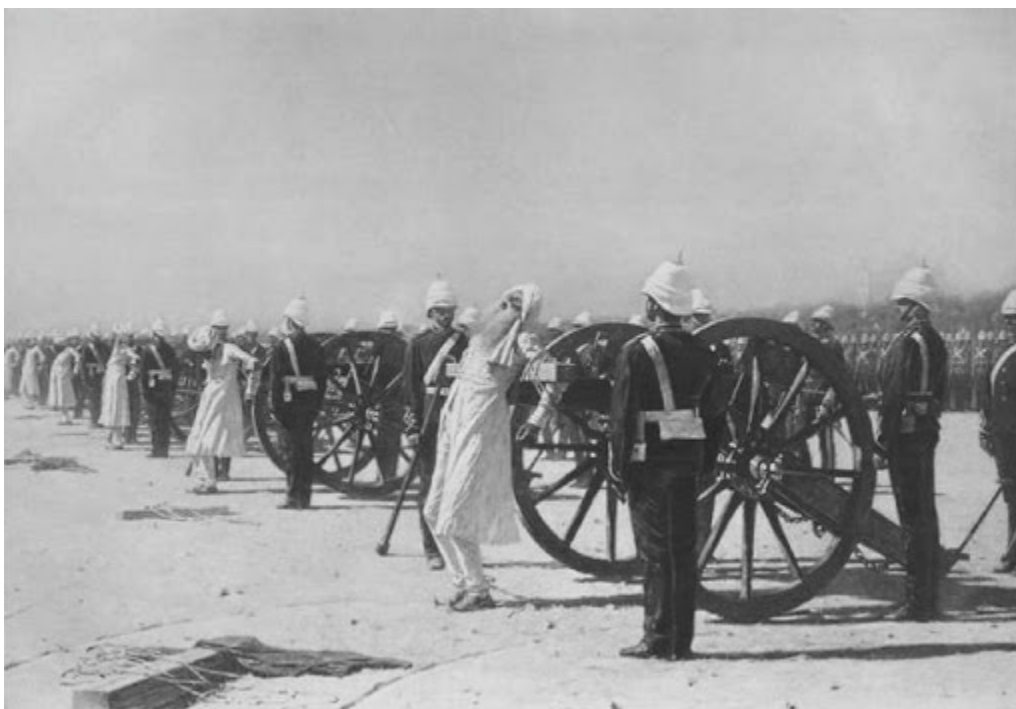
Казнь плененных сипаев