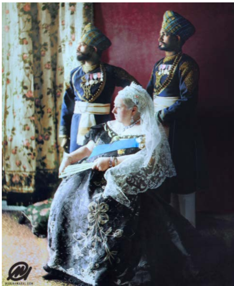
Мы очень счастливы вместе. Королева Виктория и индийцы.

Впоследствии британское правительство отменило власть Ост-Индской компании, и Индия стала территорией Короны, которой непосредственно управляла королева Виктория (теперь Императрица Индии) в установившейся системе правления, известной как Raj , британское колониальное правление в Индии. Последующие десятилетия были заполнены британскими заверениями самих себя, что их новое колониальное правление якобы решило все проблемы и устранило злоупотребления со стороны Ост-Индской компании, некомпетентность которой, по-видимому, привела к Мятелу. Они участвовали в пропагандистской кампании, которая романтизировала Индию и преувеличивала любовь и верность индийцев Великобритании и королеве. Это было чем-то вроде другой кампании примирения во второй половине девятнадцатого века, происходившей в Америке, но менее убедительной (вероятно, благодаря тому факту, что бывшие воюющие стороны в Гражданской войне в США были представителями одной и той же расы). Более циничные наблюдатели отметили, что «Восстание создало наследие расовой ненависти, которая проникала во все аспекты отношений между правителем и управляемыми». [15] По крайней мере Сипайское восстание привело к годам подозрений и страха.