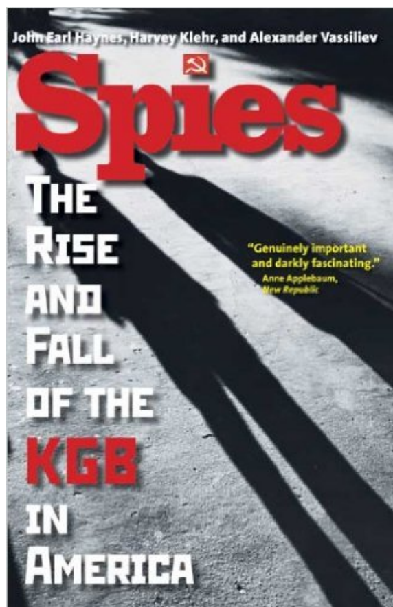
Обложка книги «Шпионы. Взлет и падение КГБ в Америке»