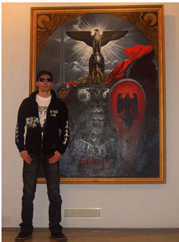
Хендрик М. перед картинами художника Константина Васильева. Домашний музей, Череповецкая ул., 36, Москва, в 2008 г.