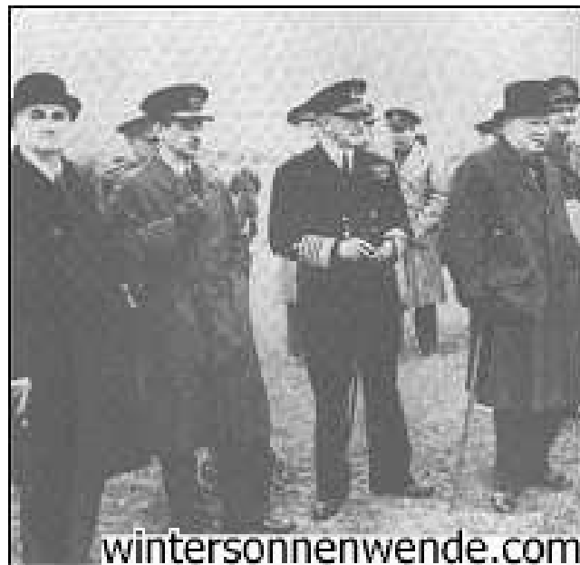
Сэр Чарльз Портал и Первый морской лорд сэр Дадли Паунд.

Инициаторы, направившие Бомбардировочное командование на ковровые бомбардировки городского населения Германии: Ф.А. Линдемманн (слева) и Уинстон Черчилль (справа). Между ними Маршал авиации