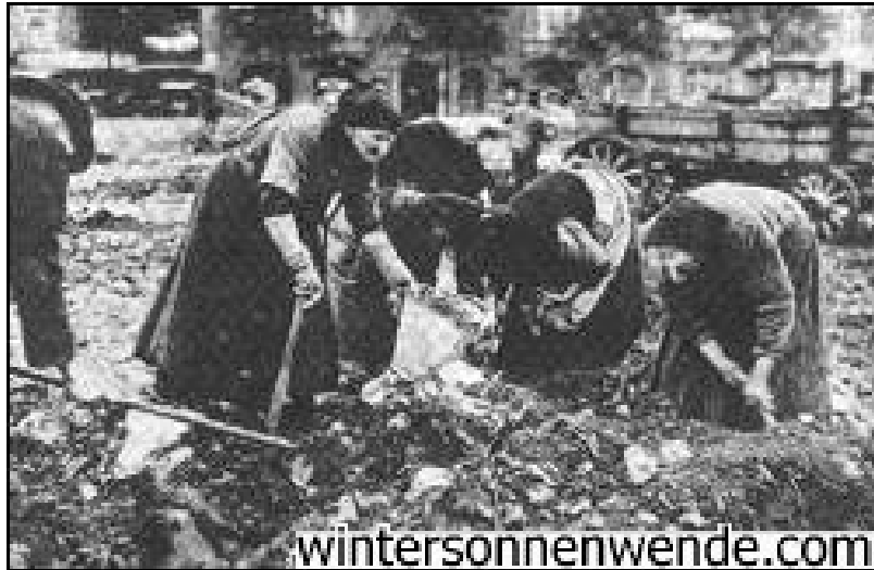
Пожилые немецкие женщины ищут съестное в мусорных кучах в Берлине в 1919 году.

Дания и Бельгия должны были разделить различные приграничные регионы, а Лига Наций должна была управлять немецкими колониями.