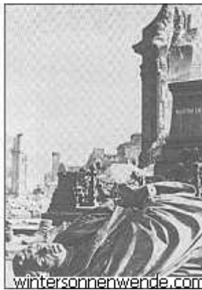
Статуя Мартина Лютера – памятник культуры до и после союзников.

Из «Первой жертвы»: «Правда впервые стала известна в Швеции. 15 февраля в 10 часов 15 минут шведская информационная сводка, которая передавалась на датском языке на оккупированную Данию, сообщила, что количество погибших в Дрездене уже составляет от 20 до 35 тысяч человек». Затем газеты в нейтральных странах начали публиковать статьи о налете. 17 февраля агентство «Ассошиэтед Пресс» сообщило на всю Америку: «Командующие