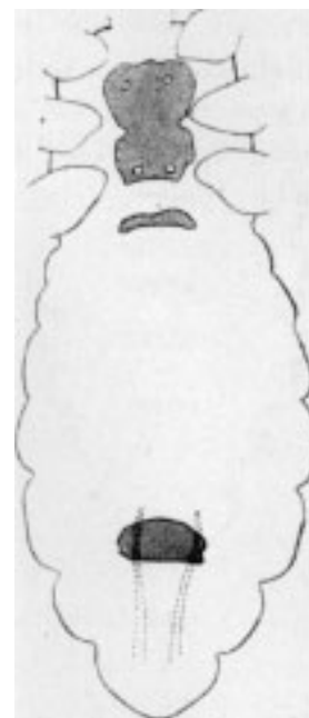
Рис. 3. Pediculus capitis var. maculatus Fahrh. ♂. Грудь и брюшко вентральные, с грудinou и двумя срединными пластинками на брюшке. – У негра.

широко распространяются на верхнюю сторону; в их центре видно светлое пятно, в котором находятся стигмы. Поперечные пластинки на дорсальной стороне брюшка (иллюстрация XXI Рис. 3) у ♂ окрашены в темно-коричневый цвет. Дорсальная сторона ♀ только на последнем сегменте несет две коричневые пластинки, похожие на те, которых можно увидеть у вида Haematorinus . Вентральная сторона у ♂ имеет кроме широкого поперечного пояса третьего с конца сегмента (рис. 3 в тексте) еще один намного меньший, согнутый вперед на втором сегменте. Грудина отчетливо окантована у обоих полов. Как показывает сравнение рисунков 3 и 4, она в основной форме различна у разных полов; кроме того, грудина у ♂ имеет четыре отверстия, а у ♀ только два отверстия, которые служат для введения волосков. Края грудной части после брюшка отдаляются друг от друга. Брюшко особенно у ♀ (иллюстрация XXI Рис. 2) очень широкое в сравнении с длиной и имеет эллиптическую основную форму; у ♀ брюшко по ширине еще превосходит европейскую форму, в то время как по длине оно еще уступает японской. Большой палец большой берцовой кости первой пары ножек у ♂ с наружного края прямой, тогда как у обеих сравниваемых форм он слегка согнут; коготок приблизительно такой же длинный, как у японской разновидности, однако, зубчатость оказалась еще тоньше. – Я собрал более точные цифровые данные в таблицу на странице 601.