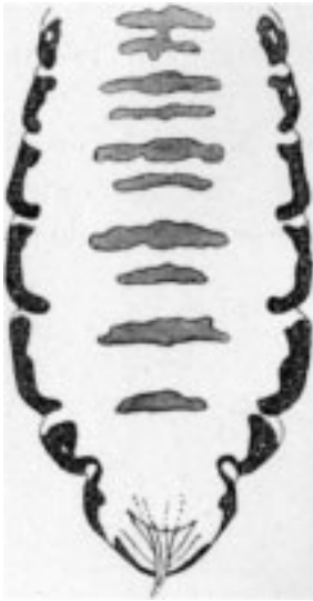
Рис. 2. Pediculus capitis var. angustus Fahrh. ♂ брюшко, дорсальная часть. – У японца.

Эта разновидность живет на японцах. Препарированные в канадском бальзаме экземпляры при незначительном увеличении показывают желтоватый фоновый цвет, который в районе груди и ножек переходит в светлый коричневый цвет, в то время как при тех же самых условиях вошь европейца демонстрирует в качестве основного (фонового) цвета грязно-серый цвет иногда с несколько желтовато-коричневым оттенком. Эта окраска настолько характерна, что по ней всегда можно различать обе сравниваемые формы. Хитинизация очень сильно выражена в особенности по краям брюшка; пластинки на краях тонки, кажутся, однако, даже в канадском бальзаме еще насыщенно черными. Поперечные пластинки на дорсальной стороне брюшка у ♂ (Рис. 2) проявляются действительно отчетливо; похожую, но более обширную пластинку несет третий с конца сегмент на вентральной (брюшной) стороне. Грудина, даже следа которой нельзя обнаружить у вшей европейца, развита как коричневое пятно с расплывчатыми краями.