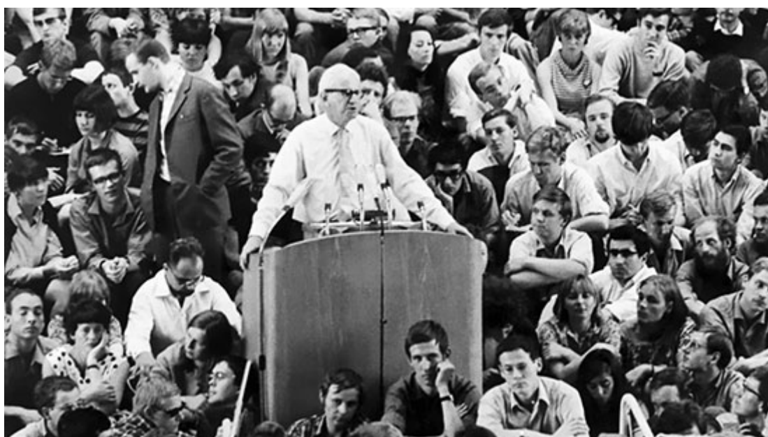
Белые студенты размышляют над лекцией Герберта Маркузе об «одномерном уме» белой расы.

Перевод с английского, 2020 г. На русском языке публикуется впервые!