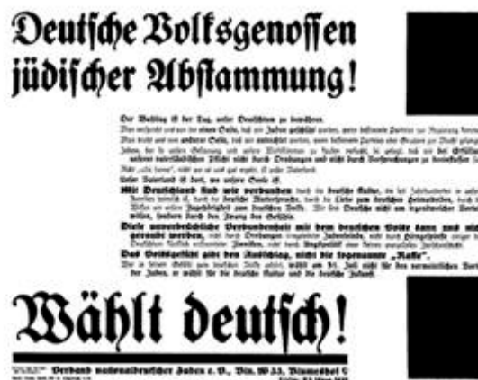
«Голосуйте по-немецки!»: плакат Союза национально-немецких евреев к выборам в рейхстаг в июле 1932 года

Продвижение Национал-социалистической немецкой рабочей партии к власти в начале 1930-х годов и установление ее диктатуры в Германии в 1933 году были потрясением для немецких евреев. Эра гражданского равенства евреев в Германии закончилась – первые нацистские указы апреля–мая 1933 года ясно показали это, – и вставал вопрос, как на это реагировать. Иллюзия того, что Гитлер пришел ненадолго и скоро ответственные немецкие политики одернут зарвавшихся хулиганов-нацистов и восстановят веймарский республиканский порядок, прошла быстро. Ясно было и то, что антиеврейская политика нового режима опирается на широкую народную поддержку и, даже если нацистов сменит любая другая правая партия, германские евреи уже не вернуться к прежнему положению полноправных граждан, каковыми они были с 1871 года, года объединения Германии.