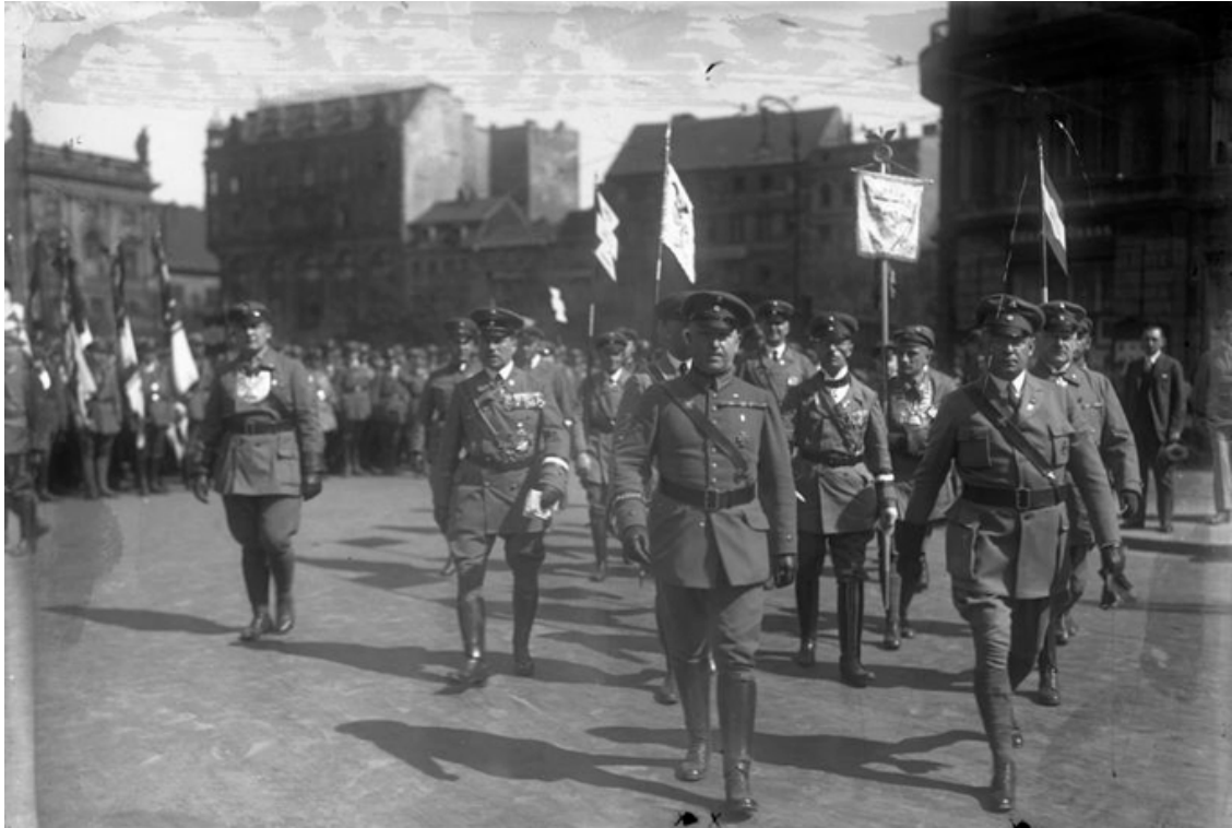
Руководитель Стального шлема (Stahlhelmführer) Дюстерберг выступает кандидатом на президентских выборах. Фотография сделана в феврале 1932 года