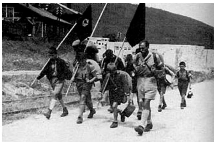
Члены еврейской молодежной организации «Шварцес Фенляйн»