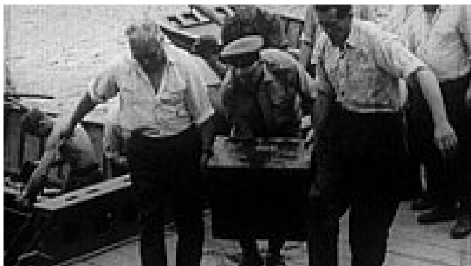
«Акция Нептун – Черное озеро»

После жесткого сталинизма 1950-х годов в 1960-е наступает «оттепель» и в Чехословакии. Тем не менее, в 1965 году должен был подойти к концу двадцатилетний срок давности военных преступлений, совершенных во время Второй Мировой войны. С точки зрения чехословацкой стороны, та денацификация, которая проходила в Западной Европе и, особенно в Германии, была недостаточной; большое количество военных преступлений осталось безнаказанными, а военные преступники продолжали разгуливать на свободе. В чешских списках значились тысячи имен военных преступников, значительная часть которых как раз находилась на территории Западной Германии.