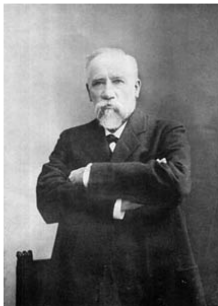
Iwan Alexejewitsch Sikorski