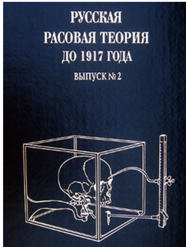
Umschlag der russischen Auflage Moskau 2004

Artikel- und Bucharchiv Velesova Sloboda, 2007