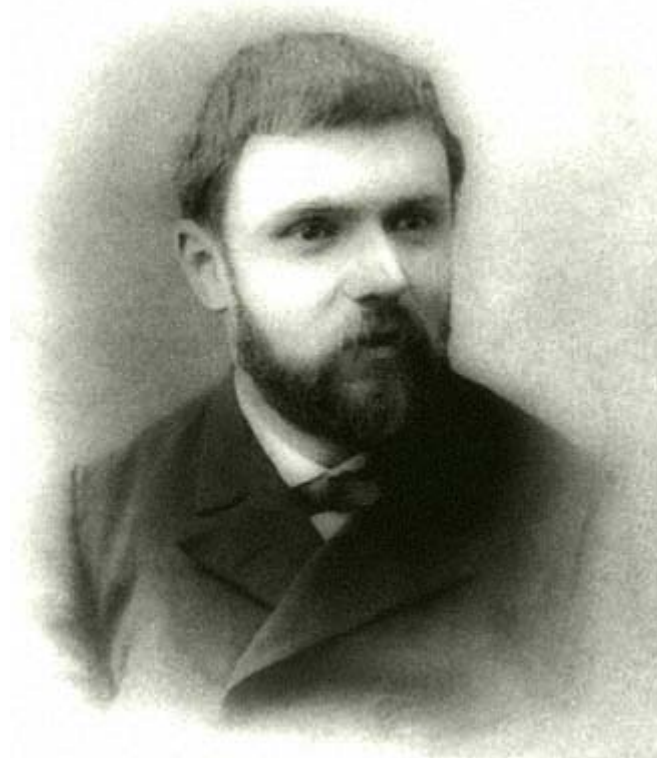
Jules Henri Poincaré

Im gleichen Jahr fand die Weltausstellung zugleich mit der zweiten Olympiade in Paris statt. Poincaré war zu dieser Zeit schon als Wissenschaftler weltbekannt. Man hielt ihn wegen seiner hohen Intelligenz für ein beinahe überirdisches Wesen. Er wurde dann von der französischen Regierung beauftragt, ein Symposium über Physik zu organisieren. Poincaré lud die besten Wissenschaftler der Welt ein, um den Holländer Hendrik Lorentz zu ehren und den fünfundzwanzigsten Jahrestag seines Dokortitels zu feiern. Der Beitrag von Poincaré für die Festschrift enthält die theoretischen Folgerungen, die ihn zwei Jahre zuvor dahin geführt hatte, die Formel E=mc^2 zu formulieren, das heißt, daß er sie mindestens schon im Jahre 1897 kannte. Einstein schreibt über die Formel erst im September 1905 – ohne Poincaré zu zitieren – in einer Note für die Annalen der Physik und wird seitdem von einer bestimmten Presse als der größte Wissenschaftler der Welt gefeiert.